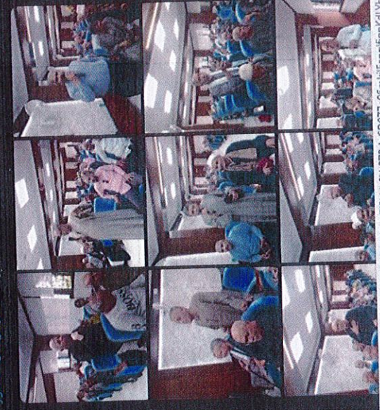
عرض كل الصور